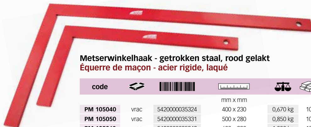
Metserswinkelhaak - getrokken staal, rood gelakt Équerre de maçon - acier rigide, laqué