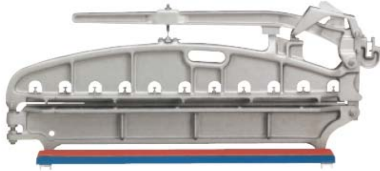
Fig. 3 : La guillotine

Outils utilisés sur le chantier pour le travail des ardoises