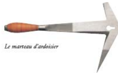
Le marteau d'ardoisier