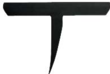
Fig. 6 : L'enclume