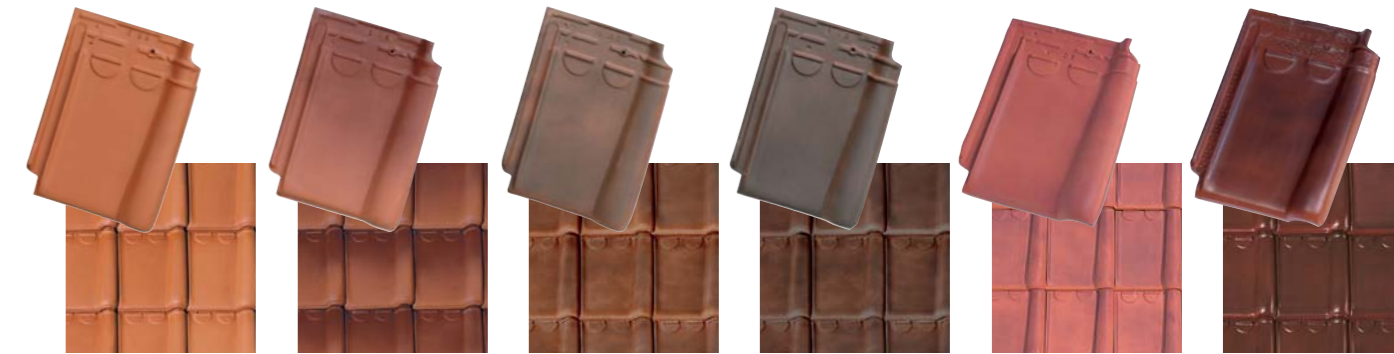
Rouge Amarante Rustique Vieux cuivre Violine Lustré

NATUREL Nos tuiles terre cuite sont issues de la nature et élaborées dans le plus grand respect de ses ressources, offrant une solution durable, authentique et esthétique pour la construction de maisons d'habitation. Les tuiles en terre cuite disposent d'une FDES (Fiche de Déclaration Environnementale et Sanitaire). Elles s'inscrivent ainsi parfaitement dans la démarche HGE® (Haute Qualité Environnementale).