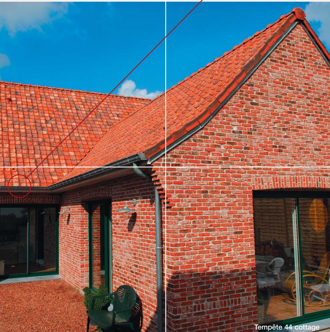
Tempête 44 cottage