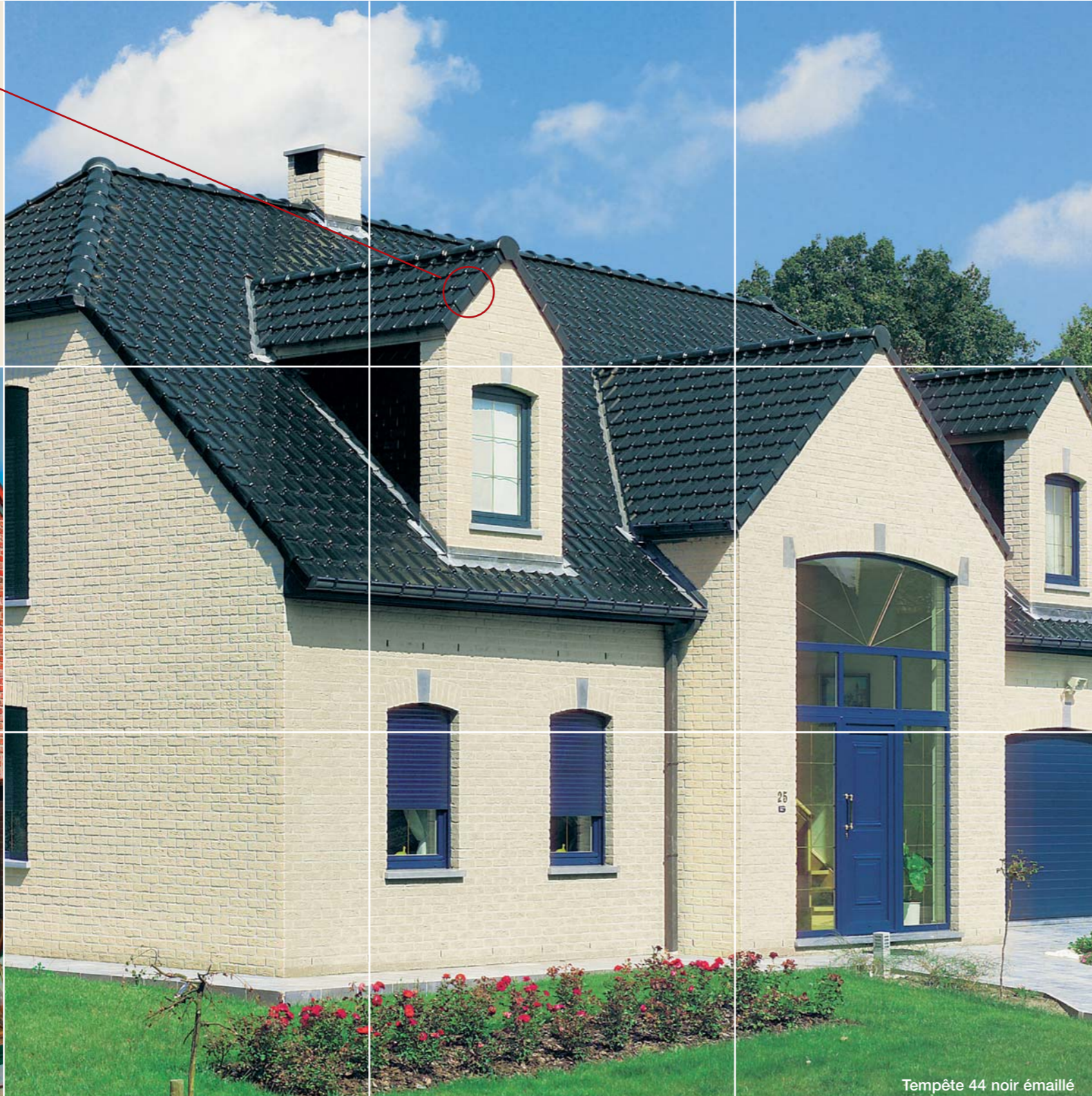
Tempête 44 noir émaillé