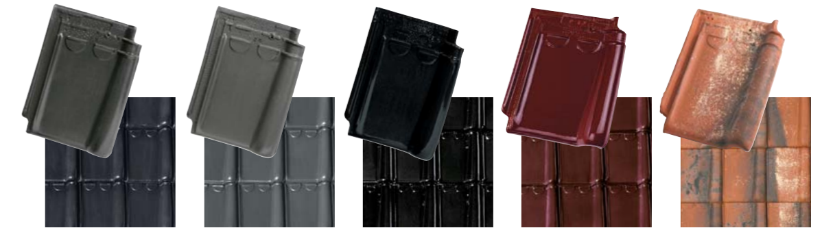
Anthracite Gris ardoisé émaillé mat Noir émaillé Lie-de-vin émaillé Cottage

Le caractère naturel des produits de terre cuite induit obligatoirement la possibilité de teintes nuancées. Il est donc recommandé de mélanger plusieurs palettes au moment de la pose.